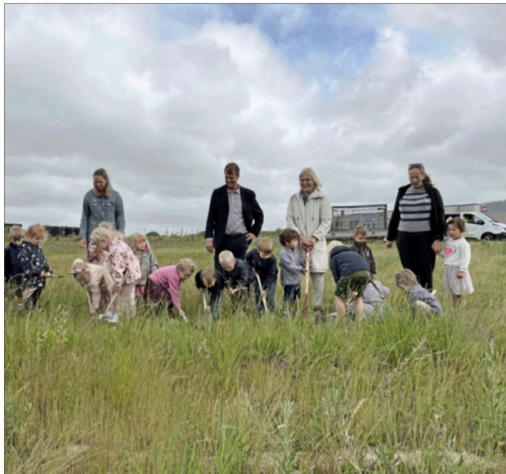
Børnene fra den nærliggende Bøgeskovgård Børnehave gav den gas med de første spadestik.

I skrivende stund er de første 10 boliger reserveret, og planen er at beboerne skal være i alle aldre. Målet er, at 1/3 af husstandene skal have hjemmeboende børn, max 1/3 skal være single-husstande