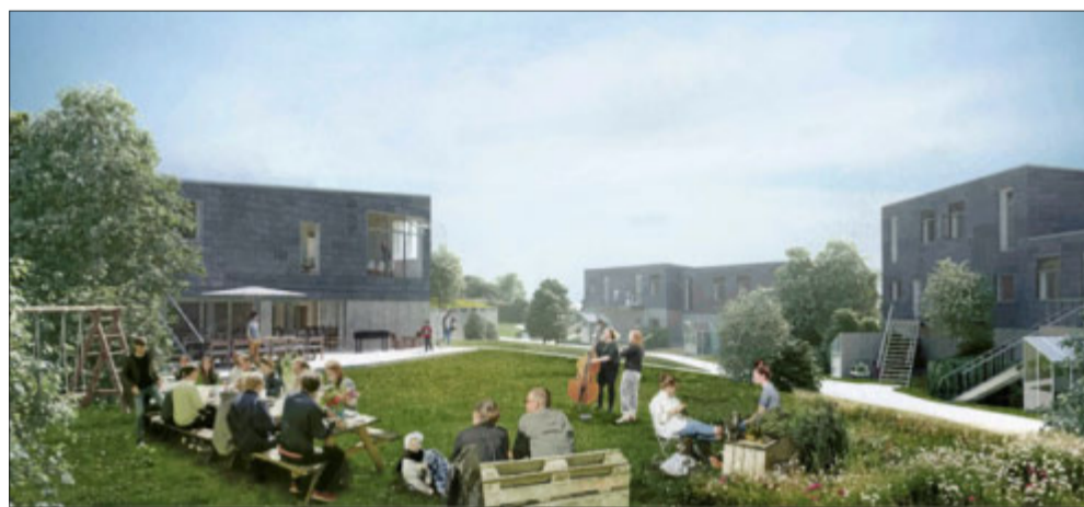
Bofællesskabet Bærebo henvender sig til alle aldre. Illustration Foto: Bærebo